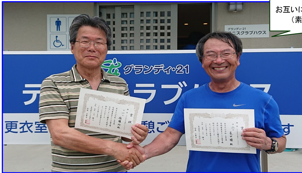
お互いに健闘を称えあう両選手。 (素晴らしい)