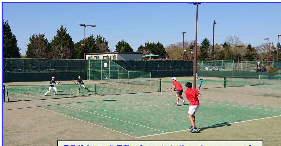
男子ダブルス 決勝戦 【4/11(日)・グランディ21 E1コート】