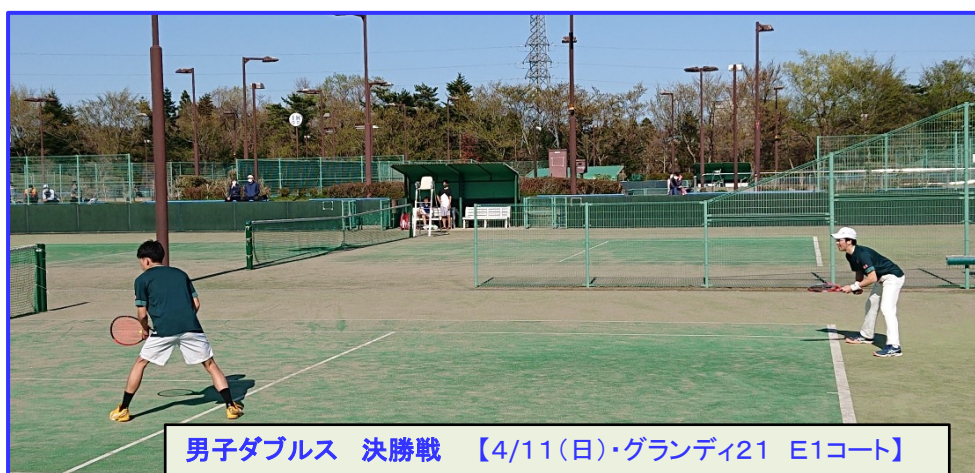
男子ダブルス 決勝戦 【4/11(日)・グランディ21 E1コート】